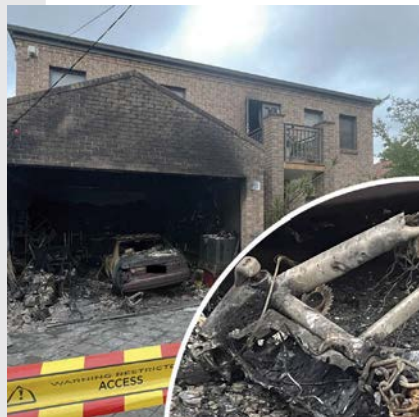
电动自行车锂电池故障导致火灾，造成房屋严重损坏。