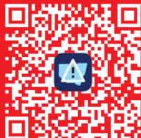
Hazards Near Me